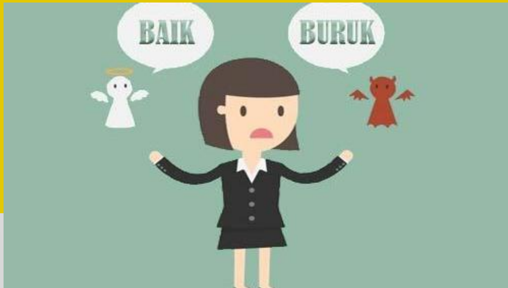
Etika/ Ethics “Moral”